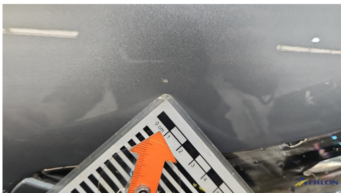
5. Kotflügel Vorne - Rechts Steinschlag