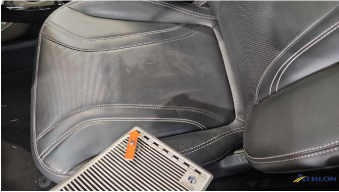
9. Sitz - Vorne - Links Gebrauchsspuren