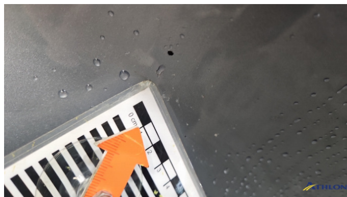
1. Stoßfänger Vorne Steinschlag