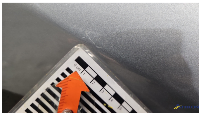
4. Tür Hinten - Rechts Kratzer