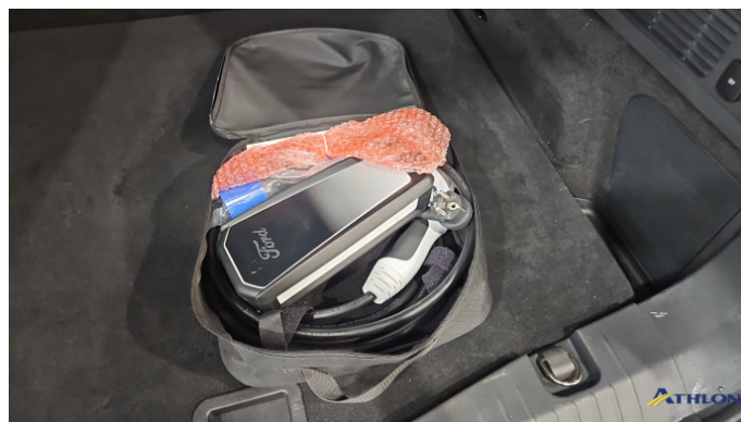
8. Ladekabel In Ordnung