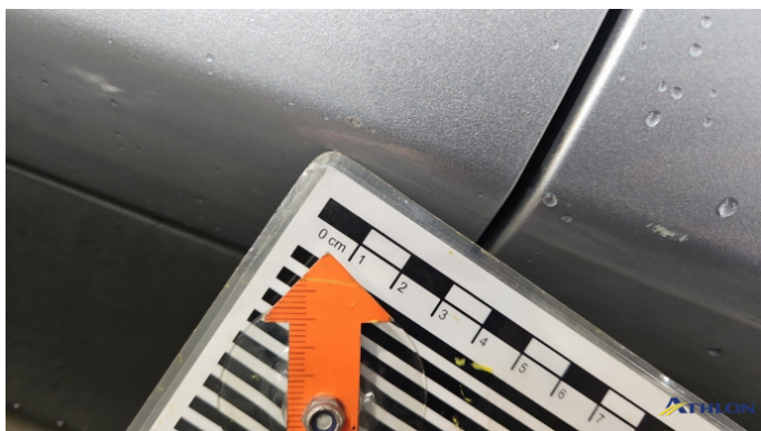
2. Tür Vorne - Links Kratzer