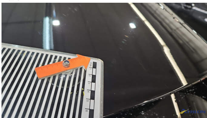
3. Heckklappe Kratzer